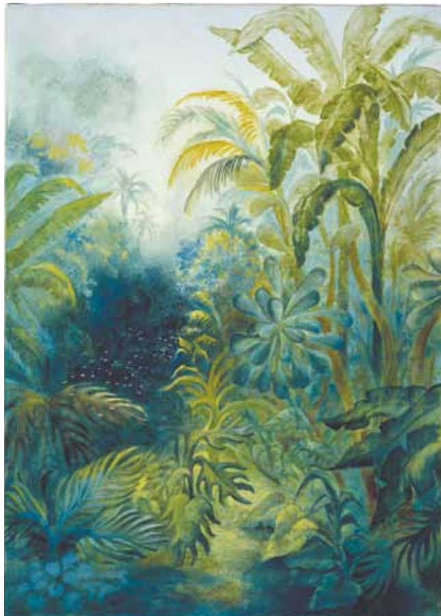
© Francis Alÿs, Djungen / The Jungle, 2003. Installation. Detalj. La Colección Jumex, Mexico

Välkommen också till övriga program på museet, t.ex. högläsning med C-O Evers, 50- & 60-talsschlagars, dikter och visor av Gustaf Fröding.